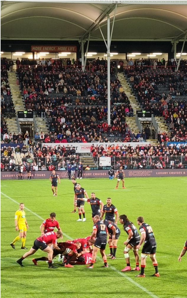
Rugby-Spiel der Crusaders in Chirstchurch