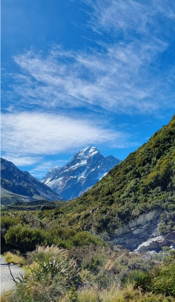
Wanderung im Mount Cook Nationalpark

In der Maori-Kultur spielt die Familie eine zentrale Rolle - auch in der Gesundheit. In Visiten war es daher normal, mehrere Angehörige physisch anwesend oder per Video zugeschaltet dabei zu haben. Für wichtige Entscheidungen wurden auch Family-Meetings einberufen, in denen mit der gesamten Familie die aktuelle Situation und mögliche Behandlungsoptionen besprochen wurden. Ein Maori-Healthworker unterstützte die Patient:innen zusätzlich.