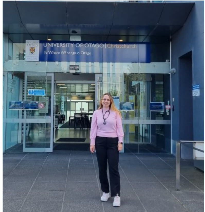
Eingang zum universitären Teil des Christchurch Hospital