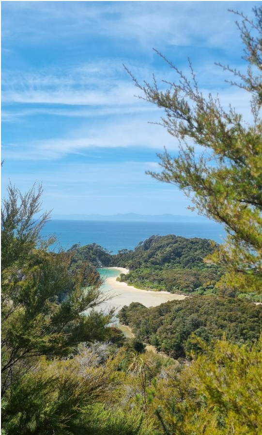
Einsame Strände im Abel Tasman Nationalpark

Du solltest genügend Zeit einplanen, um dir die wunderschöne Natur Neuseelands anzuschauen. Wer